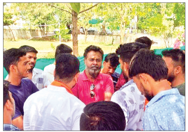
देवास। बीएनपी थाने पहुंचे हिन्दू संगठन के लोग।