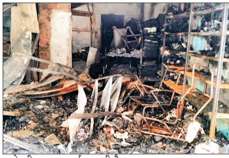
बजे की घटना बताई जा रही है।