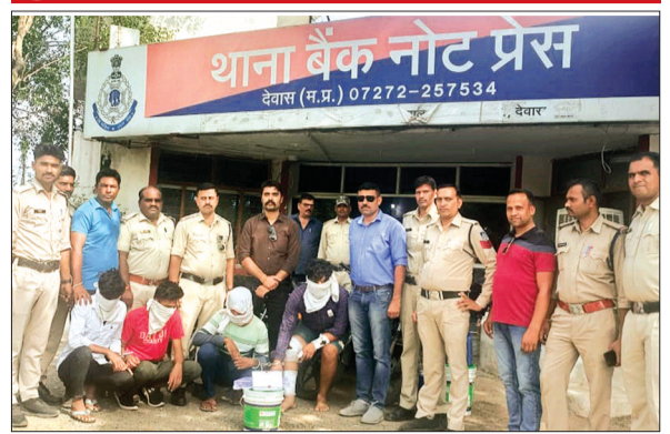
देवास। बीएनपी पुलिस ने किया खुलासा।